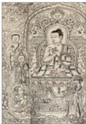
磧砂大藏经卷首图