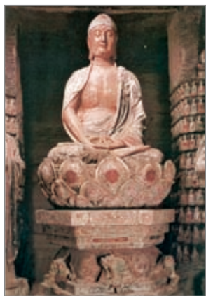
过去佛 陕西钟山石窟