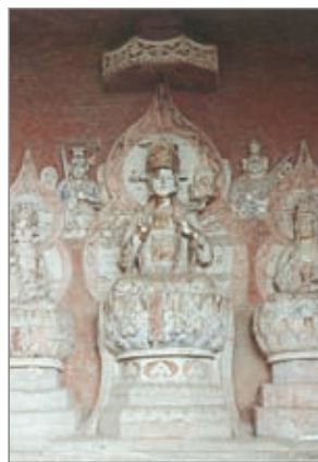
观自在如意轮菩萨