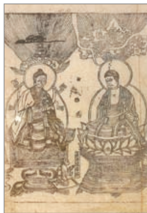
金刚般若波罗蜜经 变相图

●我们修行难在哪里？难在自私自利不肯放下，这个东西害了我们生生世世不能成就。果然把自私自利放下，起心动念想一切众生的利益，我们这一生当中可能就证得西方世界的实报庄严土，这很不可思议。