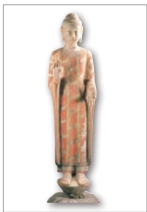
彩绘石雕释迦立像