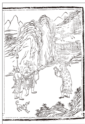
二十四孝图 鹿乳奉亲