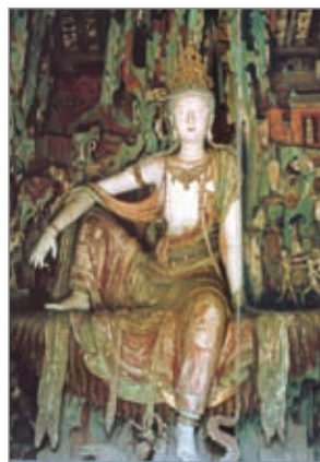
双林寺自在观音悬塑像 明 山西

明代作品。自在观音两侧有天王护佑，身后悬塑山、殿、塔、树和诸方神圣，观音左右还有善财、龙女作朝拜状。观音垂衣垂发和天衣亦塑造得极为生动飘逸。