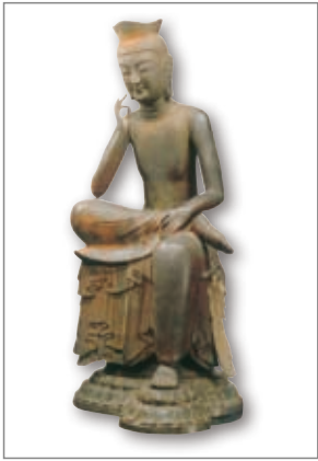
弥勒菩萨半跏思惟像