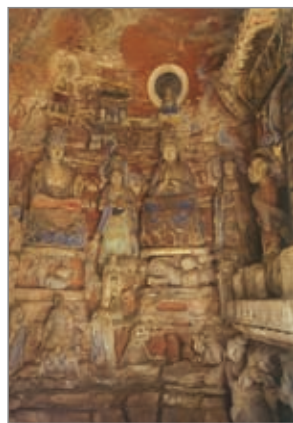
华严经七处九会集会图 大足宝顶山大佛湾第一四号窟