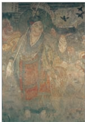
独乐寺壁画 天津市

元至清壁画。位于天津市蓟县独乐寺内。该寺壁画现存两组，一组在山门墙里侧，另一组在观音阁。山门墙内壁画有东、西山墙两块，为清光绪二十七年（一九〇一）所绘，均高三米，宽七·六米，总面积四五·六平方米。东山墙南北两侧各绘南方增长天王、东方持国天王；西山墙南北两侧各绘西方广目天王、北方多闻天王。