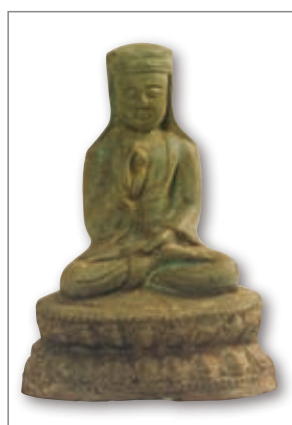
披风帽地藏菩萨 清

由于《地藏经》中讲述了地狱的情况和地藏誓度尽地狱众生的大愿，所以在民间，常把地藏菩萨看成地府的主宰，或称为「幽冥教主」，甚至认为他是阎王的上司。