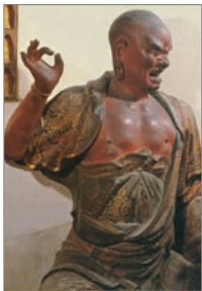
白马寺降龙罗汉像