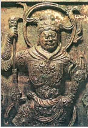
金铜四天王舍利函 (广目天王)