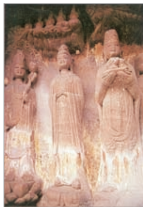
供养菩萨、女真、 大势至菩萨