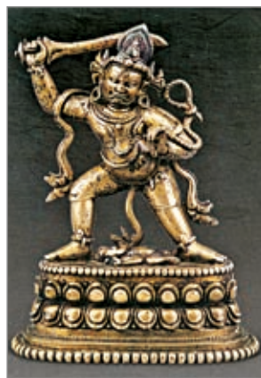
不动明王 十三世纪

不动明王亦称不动使者或不动尊，佛教密宗五大明王主尊、八大明王首座，大日如来的教令轮身。在镇守东南西北中五个方位的五大明王中，为镇守中央方位的明王，也是著名的护法神。