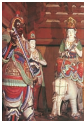
佛光寺东大殿彩塑 唐 山西

佛光寺东大殿，位于山西五台县豆村的佛光寺内，与同县境内的南禅寺大殿，均为现存最古老的木构建筑。