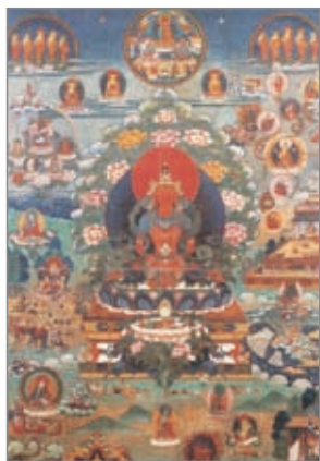
阿弥陀佛西方极乐世界 布本设色唐卡 十八世纪 西藏

这幅唐卡描绘的是阿弥陀佛净土—西方极乐世界。阿弥陀佛曾发过四十八个大愿，誓要利益六道中的众生。