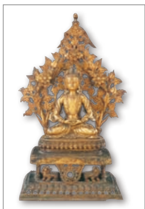
铜鎏金无量寿佛像 清

长寿佛又名无量寿佛，为法身阿弥陀佛之报身显现。在佛教中长寿佛是不分显密都非常重要的本尊。