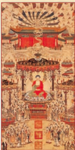
极乐世界图 台北故宫珍藏