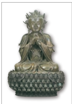
大日如来佛 (毗卢遮那佛)