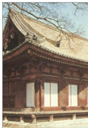
莲华王院本堂 (三十三间堂)

莲华王院本堂是日本镰仓时代著名的国宝级建筑。然而此院之名却不太为国人所知，如果称以「三十三间堂」之名时，大家立刻知晓那就是位在京都，达有一千尊千手观音造像的大堂院。