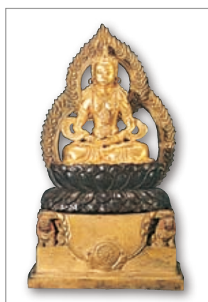
无量寿佛化身菩萨像 清

老太太每天早晨都很早起来做早饭，往生那一天，儿子、媳妇没看到母亲做早饭，觉得非常奇怪，就推开她的房门，看到老太太在床上盘腿打坐，叫她没回应，走到前面仔细一看，已经往生了。老太太的床前，留有遗嘱，而且儿子、媳妇、孙子的孝服都做好了，预知时至，自在往生。