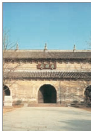
江苏南京 灵谷寺无量殿

他，只有一个办法，就是念佛求生净土。他听了之后很欢喜，回到寮房把门一关，不眠不休，一句佛号念到底。这样念了三天，把阿弥陀佛念来了。阿弥陀佛告诉他：「你的寿命还有十年，你好好念佛，等你寿命到的时候，我再来接你。」莹珂法师听了之后，对阿弥陀佛说：「再活十年，不知道又要造多少罪业，十年寿命我不要了，现在就跟你走。」阿弥陀佛通情达理，说三天之后来接他。到了第三天，他要求大众念佛送他往生，念不到一刻钟，他跟大家说：「阿弥陀佛来接我了！」就走了。《阿弥陀经》上说，「若一日、若二