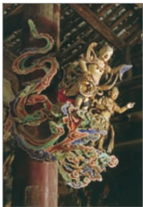
飞天神童足踩云彩