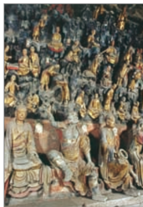
五百罗汉塑像 新津观音殿