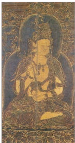
大方广佛华严经卷 普贤行愿品变相图（局部）