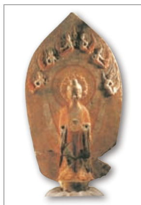
背光鎏金菩萨雕像 山东青州南北朝

该像雕刻手法繁复、细腻，采用凸棱的方式刻出衣纹，衣衫紧贴身体，充分显现着人体的优美。