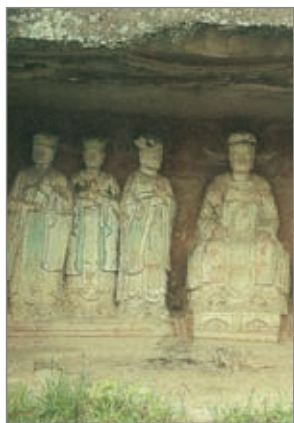
第六号窟孔子及十哲像 (局部)