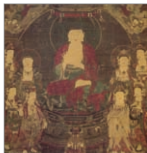
阿弥陀佛与八大菩萨