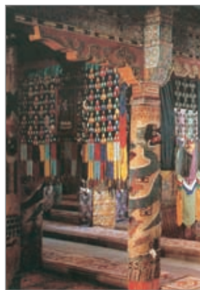
塔尔寺大经堂内景