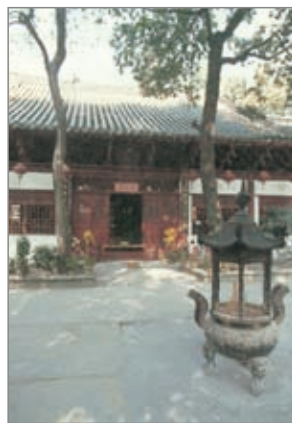
广州光孝寺六祖殿

光孝寺在禅宗史上的地位相当重要，梁武帝普通八年（五二七年），菩提达摩从南洋的海上到达中国的广州，第一站就是在此驻锡，到目前为止，还有他的一个洗钵泉保存着。