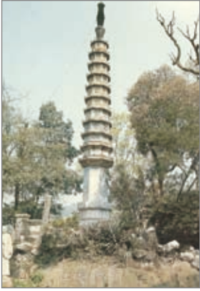
西泠印社华严经塔