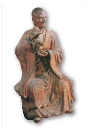
白马寺伏虎罗汉像