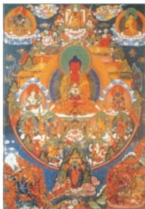
阿弥陀佛西方极乐净土 十九世纪 立基寺

唐卡，全称阿弥陀佛西方极乐净土，主尊结跏趺坐，身色为慈悲的红色，双手结禅定印托圆熟甘露果的宝钵，所以也被称为甘露王佛。